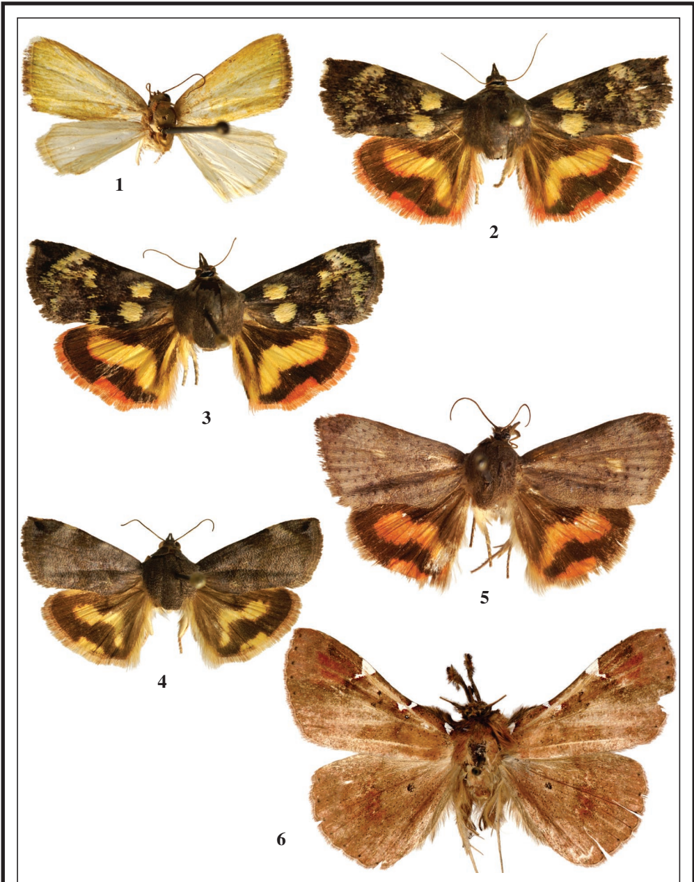
Figuras 1-6. – 1. Earias biplaga Wlk., ♂, Guinea Ecuatorial. 2. Hyblaea occidentarium Holl., ♂, Tanzania. 3. H. occidentarium Holl., ♀. 4. H. puera (Cr.), ♂, Tanzania. 5. H. puera (Cr.), ♀, Guinea Ecuatorial. 6. Macella euritusalis Wlk., ♂, Guinea Ecuatorial.